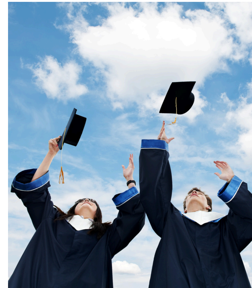
Augmentation des personnes étudiantes ayant bénéficié de ces initiatives dans les deux dernières années

La croissance marquée de la demande reflète des besoins de plus en plus urgents au sein de la communauté étudiante. Cette hausse est un rappel poignant des défis auxquels plusieurs font face, qu'il s'agisse de l'augmentation du coût de la vie ou de situations financières imprévues. Grâce à votre soutien, ces personnes étudiantes reçoivent une aide précieuse leur permettant de se concentrer sur leurs études. Pour poursuivre cet élan de solidarité, votre engagement est plus crucial que jamais.